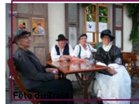
Fête du Train